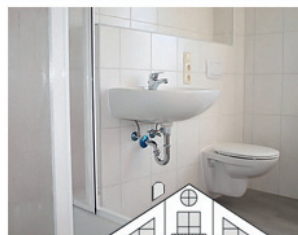
Christiane Bartz Immobilien